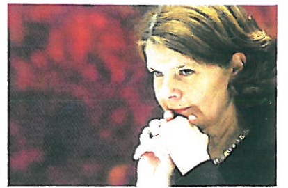
Minister Marja van Bijsterveldt heeft een punt met haar plannen voor passend onderwijs.

Kinderen met een zonder handicap moeten zo veel mogelijk samen naar school. Als dat ook nog een bezuiniging oplevert is dat mooi meegenomen.