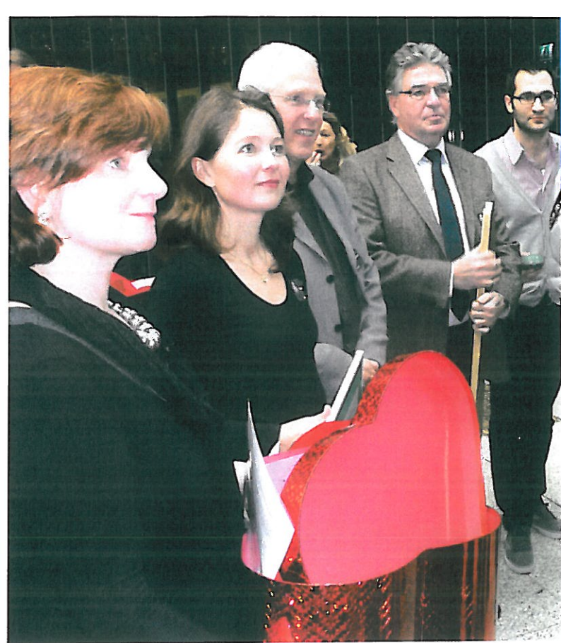
De doos met de hartenkreten van leerlingen.

epilepsie te maken. Corten: 'Onze groep kinderen kun je vergelijken met kinderen die slecht zien of horen. De groep is vrij constant van grootte en er is specifieke expertise nodig