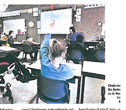
Onderwijs in Heeze. De Berkerschutte in Heeze is hard getroffen door bezuinigingen.