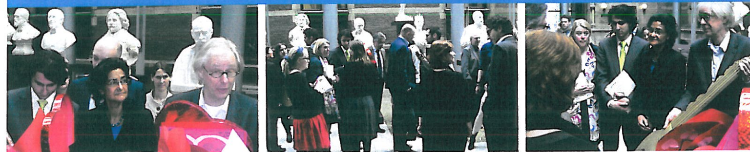
In Den Haag namen politici brieven van leerlingen en een petitie in ontvangst.

Wat gaat er gebeuren met het epilepsieonderwijs? Moeten de twee epilepsiescholen in ons land straks hun deuren sluiten? Deze vragen stonden centraal toen de regering begin 2011 de bezuinigingsplannen voor het speciaal onderwijs bekendmaakte. Ouders, leerkrachten en epilepsiedeskundigen maakten zich grote zorgen. En kwamen in actie!